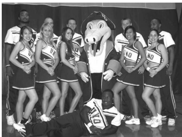
Obr. 2 Tým roztleskávačů