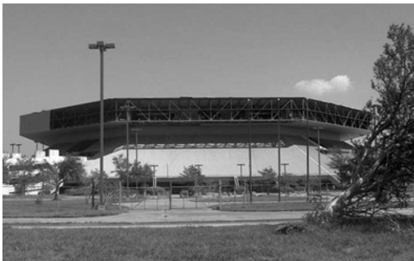
Obr. 1 Lakefront Kiefer Arena