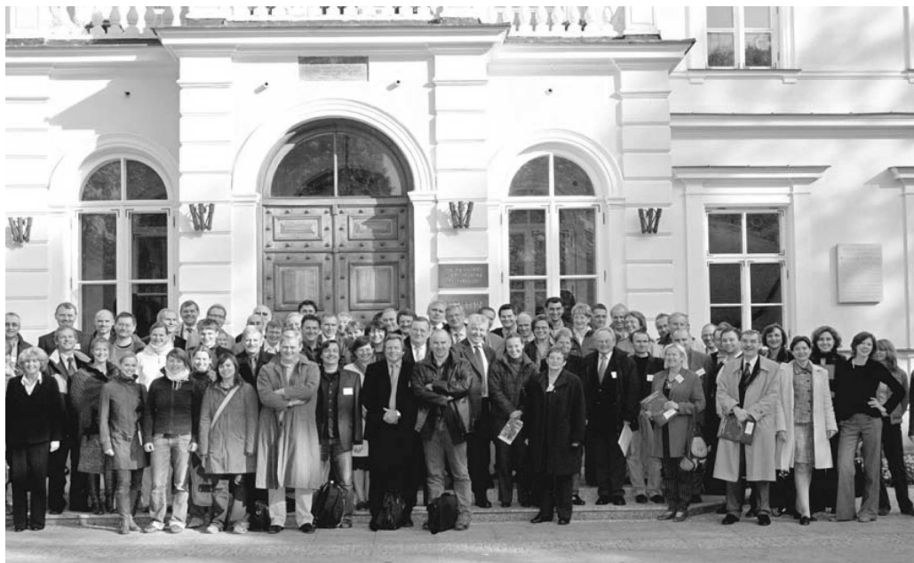
Obr. 2 Účastníci konference ELLS před rektoriátem SGWW ve Varšavě (říjen 2006)