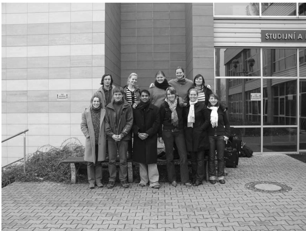
Obr. 3 Studenti ELSA před budovou SIC ČZU (listopad 2006)