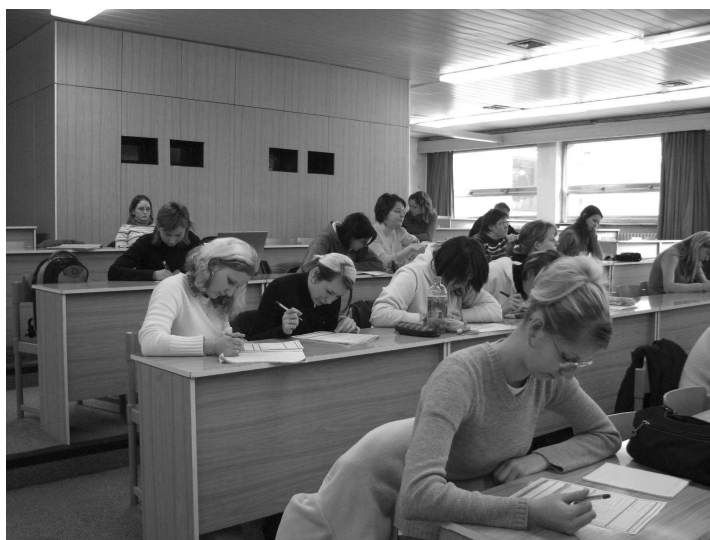
Sběr dotazníků při přednášce

Varianta odpovědi „neznám odpověď“ v dotazníku identifikuje, na jaké otázky respondenti nemohli odpovědět, a to nejčastěji z důvodu jejich neznalosti